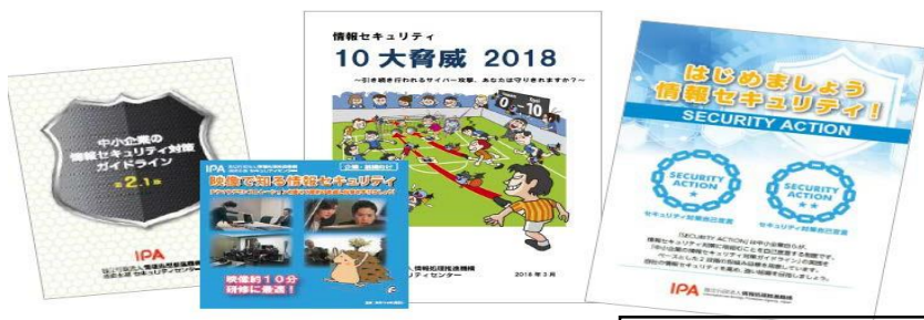
セミナー補助教材の一例

中小企業が情報セキュリティ対策を実施・支援する際に必要な、実践的な知識を学んでいただくために、全国各地で無料セミナーを開催します。